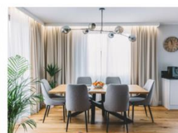
02. SALA DE JANTAR