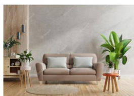
01. SALA DE ESTAR